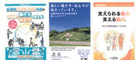
各制度に関するリーフレット(例)

「勤務間インターバル制度」「時間単位の年次有給休暇」「特別な休暇制度」などについて、企業の取組事例の紹介や、リーフレットなどの資料を掲載しています。自社における制度検討の参考にご活用ください。